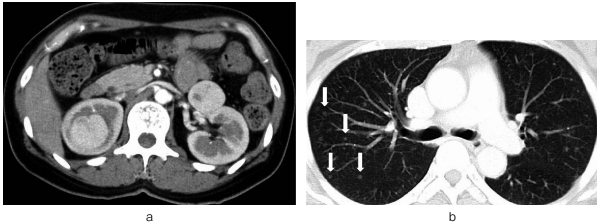
Fig. 1. a: Enhanced CT shows bilateral renal tumors. b: CT shows multiple lung nodules suspicious of lung metastases.