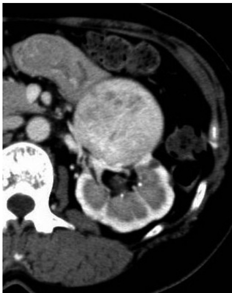
Fig. 2. The tumor in the left upper pole grew from 3.7 cm at initial visit to 6.7 cm in diameter.