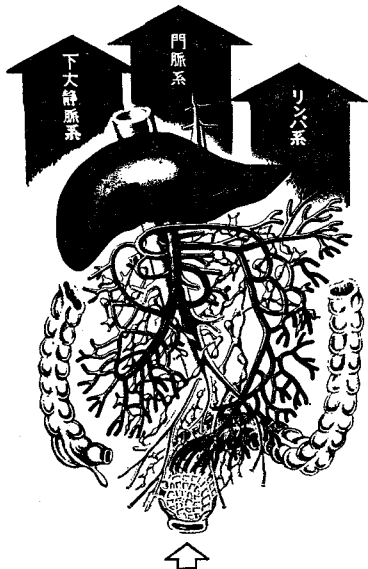
フトラフルズボ・ズボS 3つの吸収経路

パイオニアの責任とたゆまざる研究によって、 ついに、フトラフルに四つの剤型が完成しました。