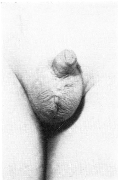
Fig. 2 Postoperative appearance (1 M)

囊および右停留辜丸に対する外陰部形成術および右辜丸固定術をおこなった。まず、右辜丸固定術 (Subdartos法) をおこない、つぎに、陰囊上縁に横切開を加え、さらにこれを延長し、陰茎根部に環状切開を加え、皮下組織を剝離して、陰囊皮膚弁を作り、これを陰茎腹側面にもってきて互いに縫合する Glenn and Anderson 1) の術式に準じて、外陰部形成術を施行した (Fig. 2)。