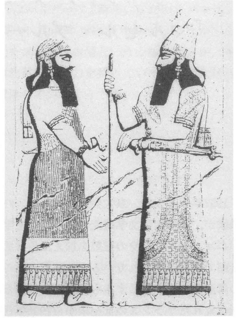
2. Rencontre de Saragon II et de son vizir (Botta, Monuments de Ninive )