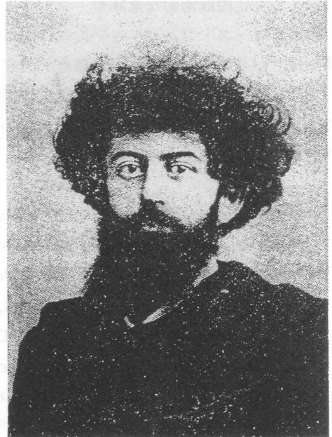
4. Joseph Péladan