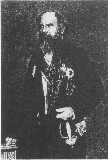
1. Paul Leroy-Beaulieu (1843-1916)