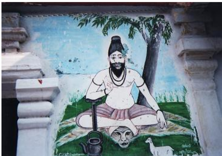
2007 年 5 月。