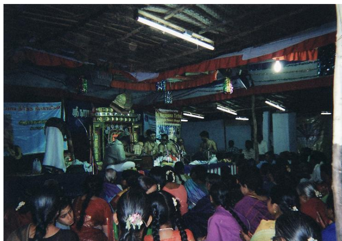
写真6 2007年度NTAの様子（ナーマ・サンキールタナ）