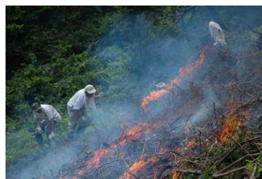
写真： 中河内での火入れ。 夏の火は赤く、目に 見える。

かつて中河内の集落は大火に二度も見舞われたこ とがあるといい、地元の方々は火の恐ろしさを十分に 知っているはずである。火は怖いものであるが、上手 く扱うことができれば、その力を活かすことができ る。地元の方の話は火に対するわきまえを教えてくれ ているような気がした。