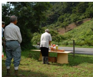
写真：火入れ前、山に向 かって祝詞をあげる。無事 に終了しますように。

8月30日。3日前の晩に雨が降ったというが、そ の後はますますの天気が続いており、地面はそこそ こ乾いているようであった。この日、火入れには 地元から11人、我々を含めた外部から18人が集ま り、結構なにぎわいとな った。火を入れる前に 我々が防火用のポンプを 準備していると、ある地 元の方がこういった。「こ の状態では、火は横や下