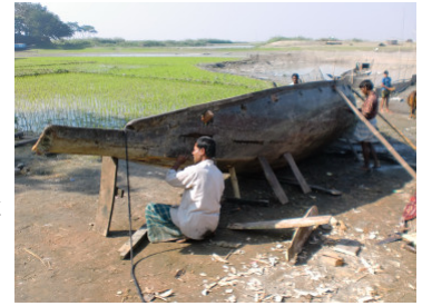
写真2: 雨季に備える為、乾季での舟の修理は重要な仕事のひとつだ

舟の修理や洗濯、行水をする者、魚とりや水鳥の世話をしている子供の姿も多く見受けられ、活気ある明るい住環境風景が広がる。