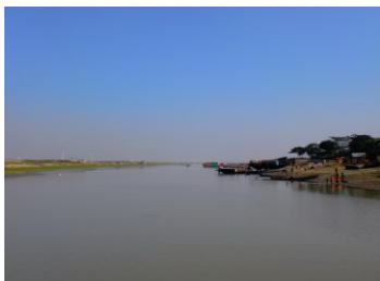
写真1: オールドブラマプトラ川支流の雄大な川風景

川と水運視察の対象として、乗船したのは1月19日(火)5キロメートル以上はゆうにある Bangladesh で最も長いジャムナ橋のかかるタンガイル県のジャムナ川(ブラマプトラ川が Bangladesh に入ると名前が変わる)と21日(木)琵琶湖の数倍の面積が雨季には水没するハオールと呼ばれるキシールガンジー県のニキール郡グルウツラ川の2度である。両河川とも日本で呼ぶ「川」とは河川幅、流量ともその規模が大き