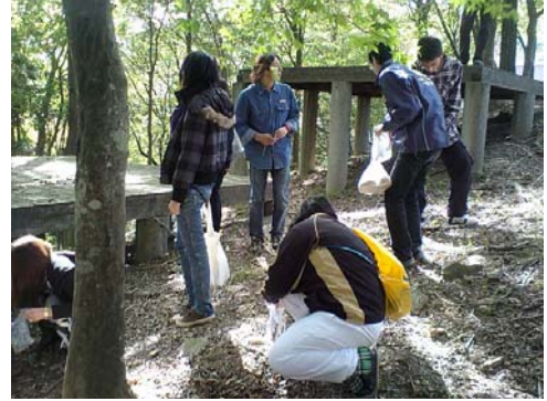
写真1:環境授業でどんぐりを拾う生徒たち

りしながら濡れた落ち葉に触り、自分たちの身体をつかって取り組んだことで、実感が湧いたようでした。「あのとき拾ったどんぐりどうなった？」と尋ねてくれる生徒もいます。