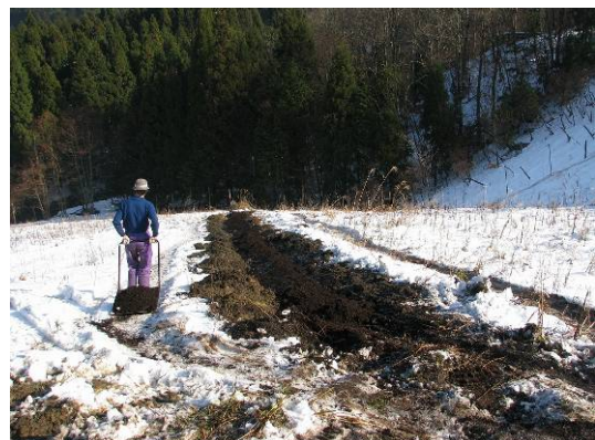
写真2:運搬作業に除雪用スノーダンプを活用

雪解けの3月にはカラス対策の網とシカ除けのネットを張る作業が待っています。3反程の実験地。その広がりを活かし、〈くらしの森〉のメニューである山菜・低木を少しずつ加えるのが次のステップです。「危機こそチャンス」という言葉があります。もしかすると、シカに痛めつけられた山や野の再生をめざしていく中で、昔の知恵と出会い直し、力をもらう場面があるのかもしれない。