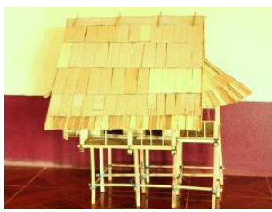
写真1:タチャンパの村人がつくった文化資料館の模型

8月、村から設計図代わりの家の模型と、工事費の見積もりが農学部に出されました。模型をもとにして、柱や梁、屋根など必要な材料が細かく計算してありました。余談ですが、村人の話では、家を建てる時、模型をつくってから工事を始めるのがふつうだそうです。(写真1)