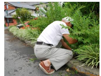
写真:畑準備中の地域の方

今回の取り組みを発表する様々な機会の中で、中心市街地の交流館でパネル展示をした際、地元の方が「種、まだあるの？」と尋ねてこられました。花がきれいだから、来年、自宅でも植えてみようと考えておられるようです。また、出来た蕎麦はいつでも食べれるのかという声も多く、少しずつ、地域に浸透し、広まればと願っています。