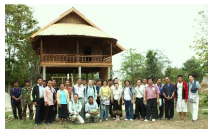
写真2:建設中の文化資料館

タチャンパ村では、年配の党書記がまとめ役として話を進め、村長が内容を詳細に記録するという連携の良さには感心します。いつも、村役の人が話し合いに出てきます。ほかの村人たちと話す機会がほとんどないので、ほかの村人たちも協力してくれるのだろうか心配になりますが4月のラオスの新年までには、滞りなく工事は終わりそうです。