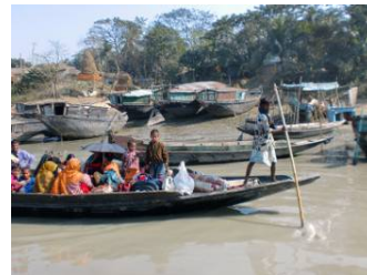
写真3: 舟は流域住民の貴重な移動手段となっている

しい川環境が形成した雄大な風景とそこで共生してきた人々の営みが息づき、魅力的で豊かな視覚的観光資源に溢れている。