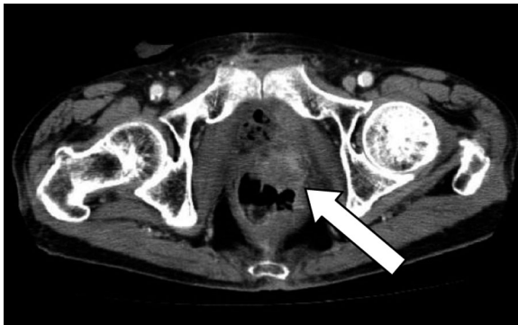
Fig. 3. Computed tomography one month after radical cystectomy shows the local recurrence about 3 cm in the left pelvic area.

あった (Fig. 2)。手術施行1カ月後から会陰部痛を訴え、CT上直腸 Rb レベルで、原発部位と対側である骨盤内左側に約3 cmの腫瘍を認めた (Fig. 3)。発熱はなく、採血上炎症反応は高値を認めず、CT所見と併せて臨床的に局所再発であると診断した。局所再発に対して小骨盤領域に2門照射40 Gy/40回、膀胱に4門照射20 Gy/20回の計60 Gy、放射線照射を施行した。照射後のCT上、complete responseを得られ、疼痛も軽快した (Fig. 4)。その後1年半経過した時点で再発、転移なく、現在外来経過観察中である。