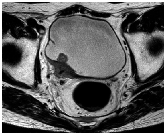
Fig. 1. MRI shows the invasive broad-based tumor about 3cm around the right ureterovesical junction.

画像検査：MRI で右膀胱尿管移行部近傍に長径 3 cm 程度の広茎性腫瘍を認め，周囲脂肪織に進展し，T3b の所見であった (Fig. 1)。CT 上は右水腎症と右水尿管を認め，左腎に特記すべき所見を認めなかつ