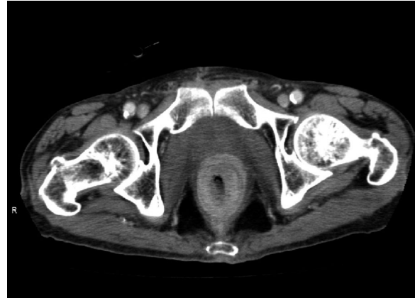
Fig. 4. Computed tomography after radiation therapy revealed disappearance of the recurrence.

膀胱癌の micropapillary variant は、卵巣の乳頭状漿液性腫瘍に類似した腫瘍として1994年に Amin ら 1) によって報告された膀胱癌の稀な亜型であり、膀胱悪性腫瘍の中で0.7%と稀な腫瘍とされている 2) 。平均年齢は66歳であり、血尿が多くの場合見られるとされている。通常の尿路上皮癌の男女比が約3:1であるのに対して、micropapillary variant は5:1と男性優位と