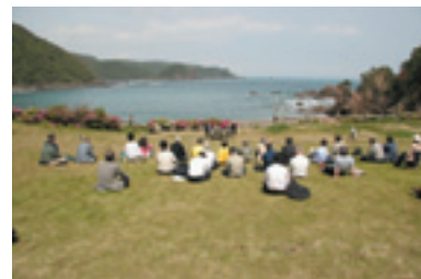
土佐の海を背景にした対談風景