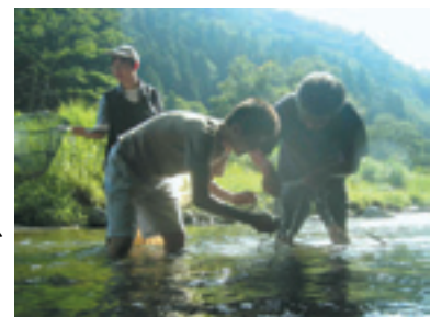
由良川でのアユの採集実習

現在、8名の大学院生が舞鶴水産実験所に在籍して、上記の研究に関わるテーマに各自が取り組んでいる。また本学の農学・理学・情報学研究科、さらには他大学の大学院生も、研究フィールドとして活用している。