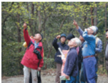
コース内での観察風景

4月22日(土)に春の一般公開自然観察会が開催された。社会教育活動の機会を増やそうと昨年からは開始された観察会である。今春の自然観察会には、定員30名に対して82名の応募があり、抽選となって、最終的には31名が参加した。参加者は午前9時30分に事務所前で概要説明を受けた後、3班(10名ずつのグループ)に分かれ、試験地職員の案内により、自然観察コースを中心に見学した。このコースでは試験地が所有する生きた樹木コレクションと京都盆地の北に広がる里山の一角に触れられる。当日は少し肌寒かったが、天気はますますで、展望台からの眺望も良好であった。ただ、昨年に比べると、春の季節の進み方が遅かったようで、コバノミツバツツジ以外