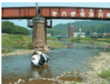
伊佐津川での調査風景 (鉄橋の向こうは5628、手前は56211)

国交省が作成した河川台帳には全国21408本の河川が、このコードと番号で分類して掲載されているが、これには本流だけではなく支流も載っている。で、この辺からがややこしい。伊佐津川についてみれば、本流の河川コードが562水系域の最後の方になる608なのに、支流の天清川は31、池内川は32、さらに池内川の支流が201から203と、本流よりも