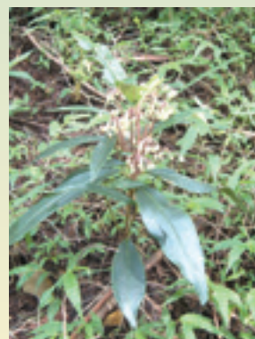
開花中の林床植物、カラタチバナ (徳山)