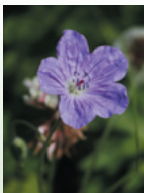
エゾフウロ (北海道)