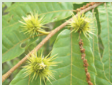
雌花から実へ育ちつつあるクリ (上賀茂)