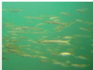
開きになる前のアジとカマスの遊泳 (舞鶴)