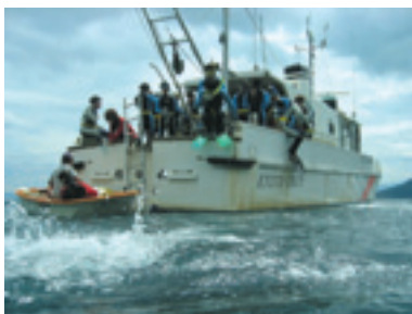
調査船から飛び込み、シュノーケリングに臨む学生たち