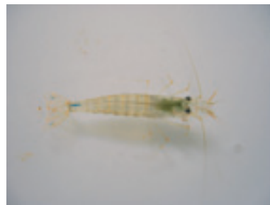
ヤマトヌマエビ：溪流部まで遡上する

ちろん、フィールド研が提唱する「森里海連環学」の材料としても、適したものであると考えました。昨年一年間は、古座川全域で、エビ類を採集して回りました。その結果、10種のエビ類が発見され、それぞれの種類