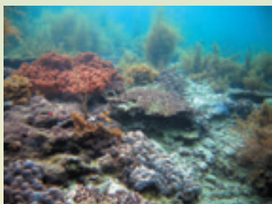
海藻とサンゴが作る海中の森 (瀬戸)