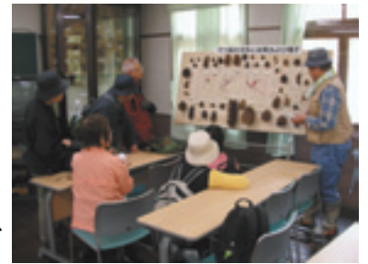
終了後の質問風景

は多くの花がまだつぼみのままで、少し残念であった。正午前には3班とも事務所に戻り、アンケートを記入して会は終了となったが、参加者の多くは午後1時過ぎまで、弁当をひろげたり、散策を続けたりとそれぞれに楽しんでいただようである。