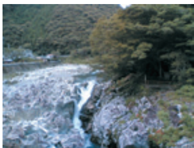
古座川・滝の畔：こんな激流もエビは昇る

川エビ類の回遊も両側回遊です。生活様式も繁殖様式も異なる魚類と甲殻類で、なぜ同様の回遊が行われるのかと考えたことが、エビの研究を始めたきっかけでした。も