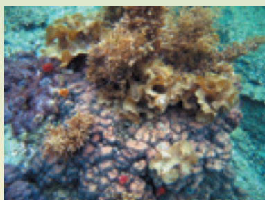
サンゴに生えた海藻 (瀬戸)