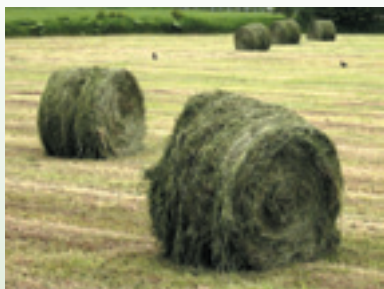
牧草ロール (北海道)