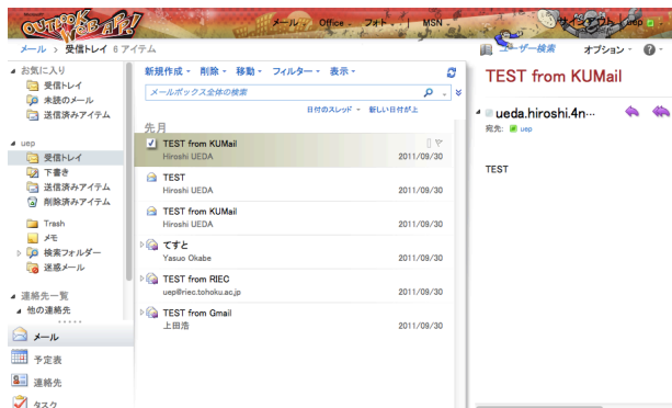
図 1: Outlook Web App スクリーンショット

既存ユーザへの移行アナウンスを開始する予定である。移行にあたり、メールスプール移行は管理者側では行わないこととした。旧学生メールは平成 24 年 9 月までに停止し、旧学生メールから新学生メールへの転送サービスを 2 年間行う予定である。