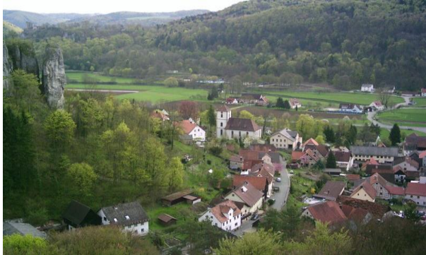
図 3 Fränkische Schweiz (Oberfranken)

当地一帯の鉱物資源探査を命ぜられた彼は、活動の拠点 としてバイロイトを選んだ。当地にはドイツ屈指のフリー メイソンのグランド・ロッジが存在し、メイソンの会員で あった A.フンボルトはこの地によく馴染んだ。彼は「皆 が親しげに話しかけ、バイロイトで私を知らない者はなか った。また、研究に打ち込めた」と記したが、後に知られ た彼の実証的な研究やフィールドワークの手法は、このバ イロイトの地で形成された。さらに彼は J.パウルの生地ヴ ンジーデルや、ギムナジウム時代を過ごしたホーフにも滞 在しており、当時、大きな成功を収めていた J.パウルにつ いて深く知り得るところにあり、彼の著作に触れていた可 能性は極めて高いと言える。