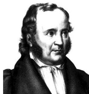
図2 Jean Paul

歴代の有能な辺境伯によって統治され, 文化芸術にも著しい発展を遂げた領邦絶対主義期のバイロイトは, 18世紀半ばに宮廷がアンスパッハに移され, 斜陽期に入っていた。この地に生まれたJ.パウル(図2)はバイロイト領邦の自然や, 宮廷の黄金期を想起しながら, その博識と機知に富んだ多くの長編小説を著し, Iで述べたような圧倒的な賛辞を持って受け入れられた。「机上の博物学者」であった彼は, 百科事典や新聞, 様々な言語の書籍を駆使しており, 彼の知的関心は世界各地そして宇宙へと, 時空を越えて縦横に往来していた。一方でA.フンボルトは「冒険(探検)の博物学者」とも称される。2人は面識こそ持たなかったが, 「バイロイトのロマン主義」の中で共通の視点を得ていた。