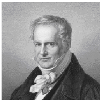
図1 A.v. Humboldt

しかし, 近代地理学の金字塔とされる大著『コスモス』は彼の青年期, 特にプロイセン王国からバイロイトに鉱山技師として任官した時代に, すでにその構想が形成されていた。「ドイツ魂の地」(アルント) といわれた, このドイツ東部境界の山岳地帯は自然に恵まれ, 多くの思想文化を育み, 後年のA.フンボルトの研究に様々な影響を与えた。それはまた, 当地に終生の棲家を得た「歌劇王」R. ヴァーグナーといったバイロイトに深く根付いたロマン主義の世界に, 若きA.フンボルトが「奇しくも」身を投じていたことを意味した。