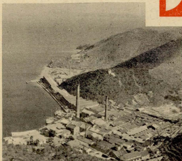
工場全景・一國立公園 播州赤穂一