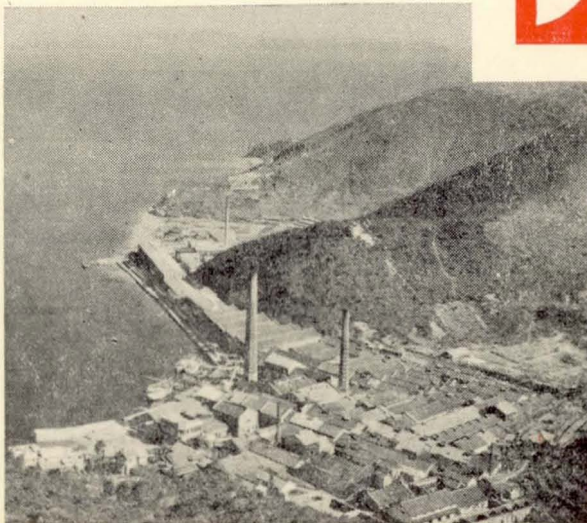
工場全景・一國立公園 播州赤穂一