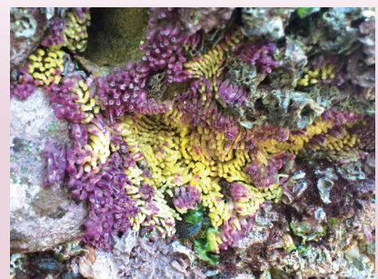
肉食性の巻貝・イボニシの卵 (瀬戸臨海実験所)