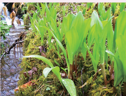
山菜シーズンスタート・ギョウジャニンニク (北海道研究林)