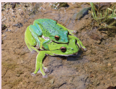
モリアオガエルの夫婦 (徳山試験地)