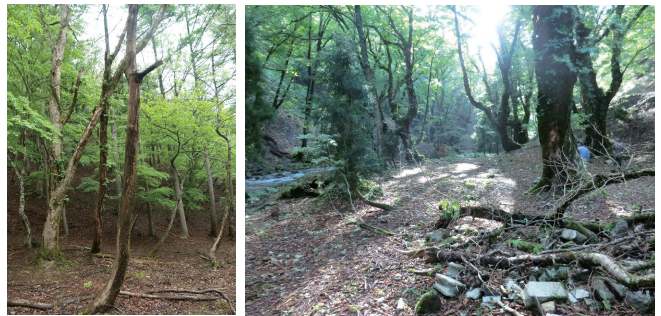
ミズナラ枯死木と、歩道が明確でなくなった林内

一般の皆様にはご不便をおかけしますが、上記の経緯および研究林の目的等につきまして、どうかよろしくご理解いただき、ご協力くださいますよう、お願いいたします。