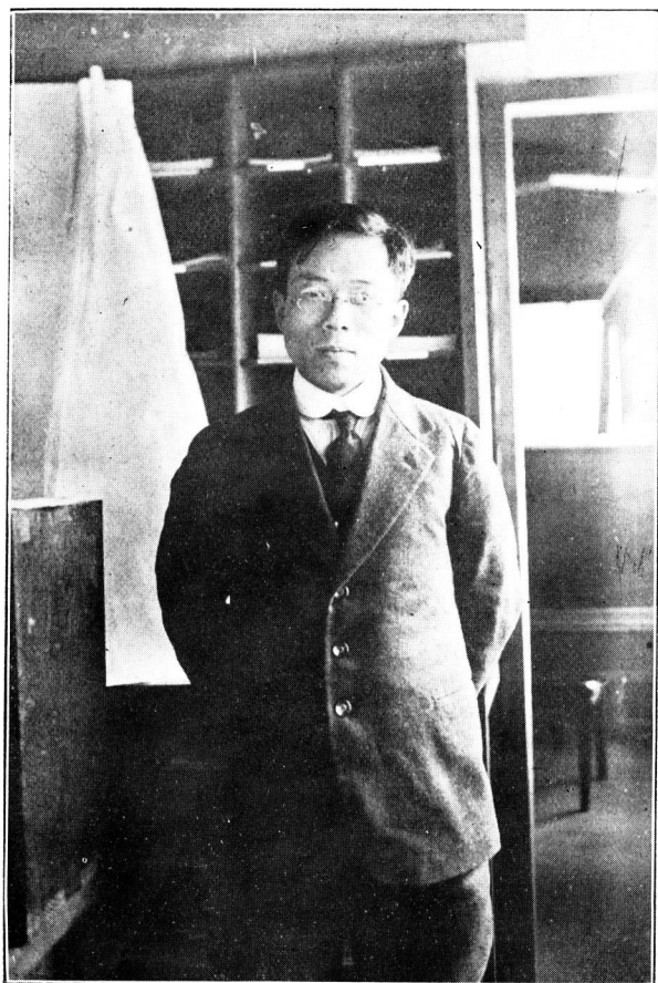
士學理本山の近最