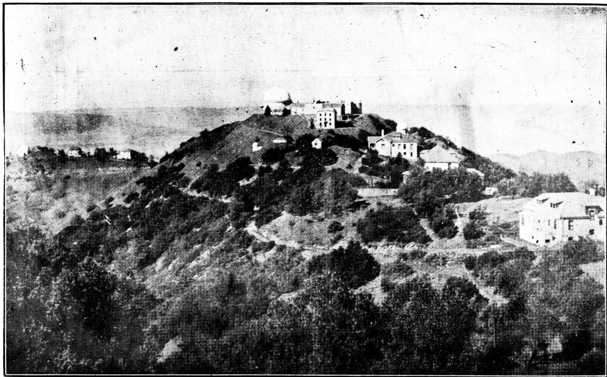
臺文天クリるた見りよ丘ルレブケ