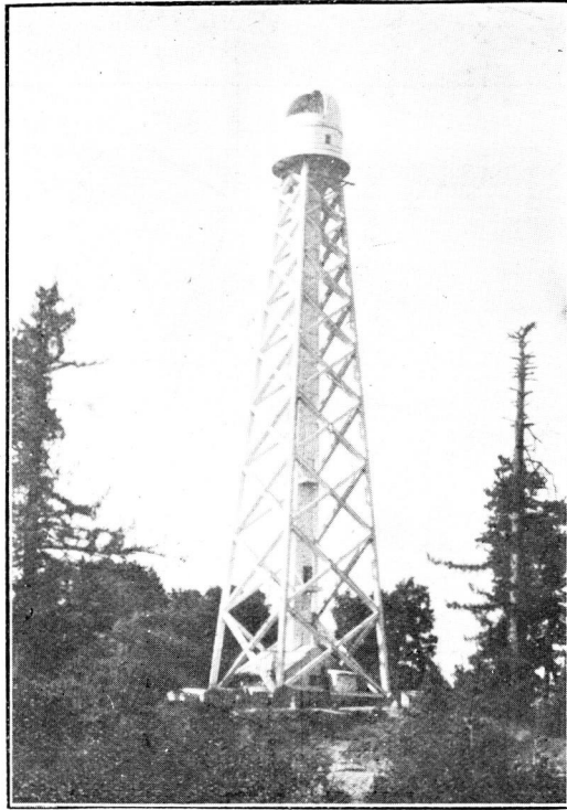
塔高呎十五百臺文天山ソルイウ