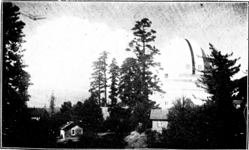
ムード鏡遠望射反吋百臺文天同