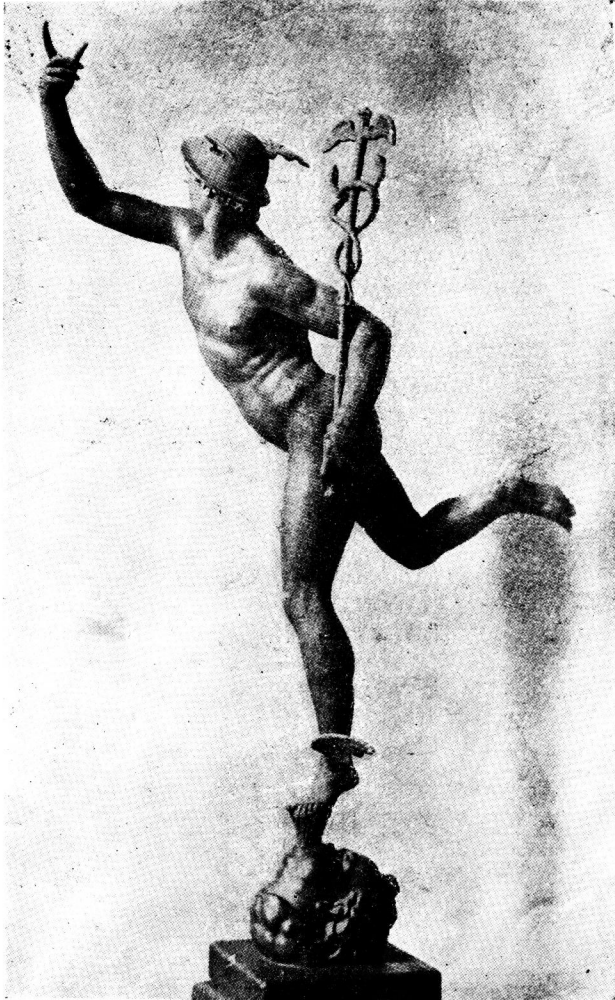
「ボロニアのジオヴンニ」作 マーキュリー神 イタリーのフィレンツェ市にあり、マーキュリーは傳令神で 天文では水星が此れに擬せられてある。

By GIOVANNI DA BOLOGNA, Italian, 1524—1608.