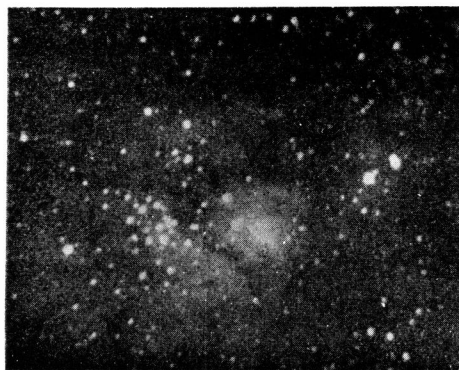
M8 射手座のメシエー八番であつて、星雲と星團と入れ交つて居る。露出30分。