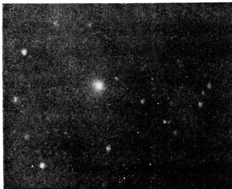
エンケ彗星 去る1月25日、魚座 \beta 附近。當時の光度は8等圓形の彗星である。露出20分。

以上は京大天文臺の、16センチF3寫眞鏡(自作)でまつたもので M57 は徑20倍、他は12倍に引伸してある。高速度寫眞鏡で30分で17等までされる。(中村要)