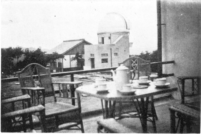
本館「御茶の露臺」より別館と宿舍を望む