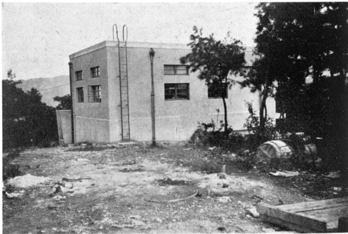
西北より見たる太陽館