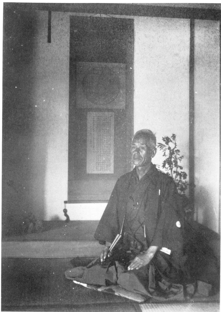
〔太陰の圖〕の前に端座する