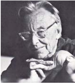
图 4 Carl Orff