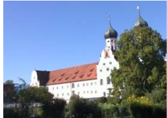
图 10 Kloster Benediktbeuern