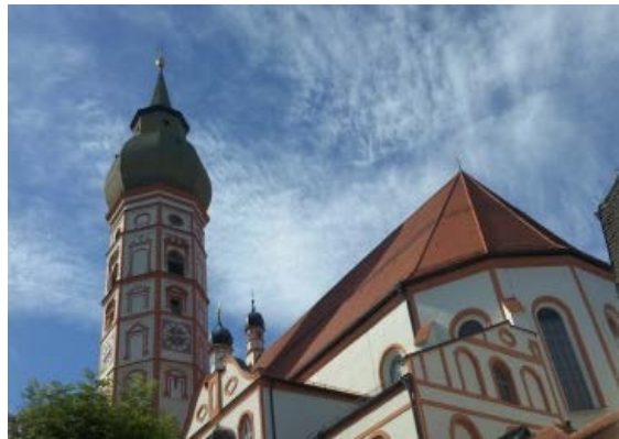
图 11 Kloster Andechs (同)