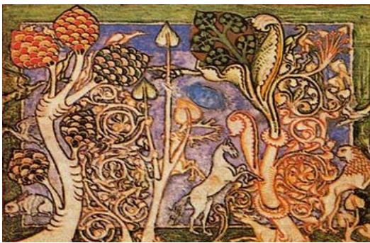
图 6 Codex Buranus-2