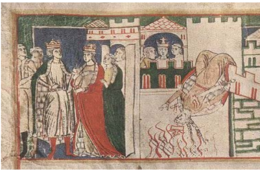
图 7 Codex Buranus-3