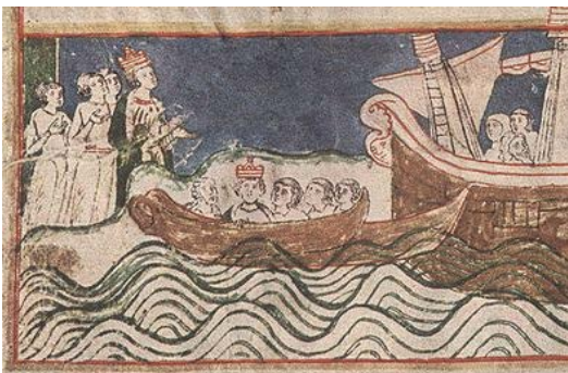
图 8 Codex Buranus-4