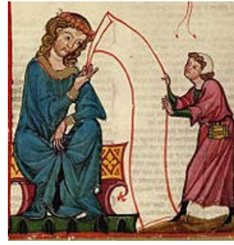
图 9 Graf Otto von Botenlauben