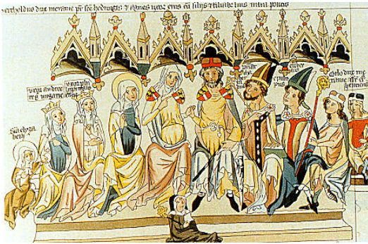
图 5 Andechs-Meran