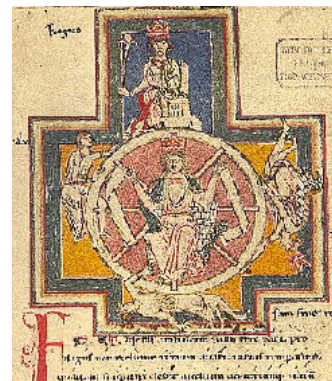
図3 Codex Buranus-1