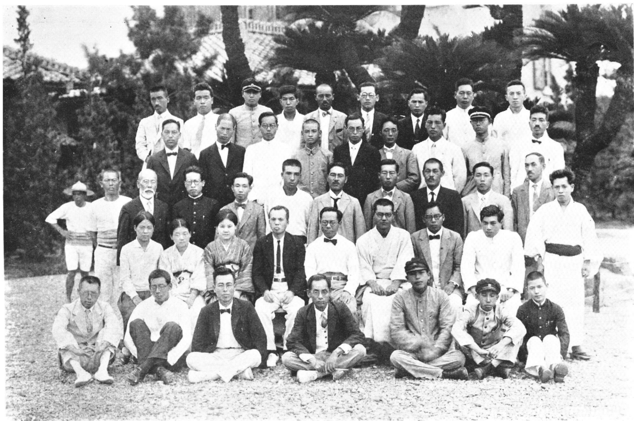
第3回倉敷天文講習會記念寫眞