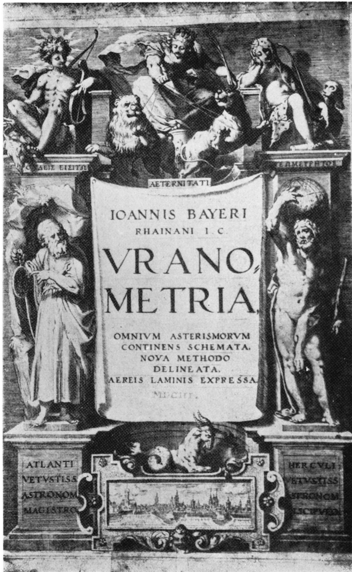
バイエル 原著 (1603年) Uranometria の表紙