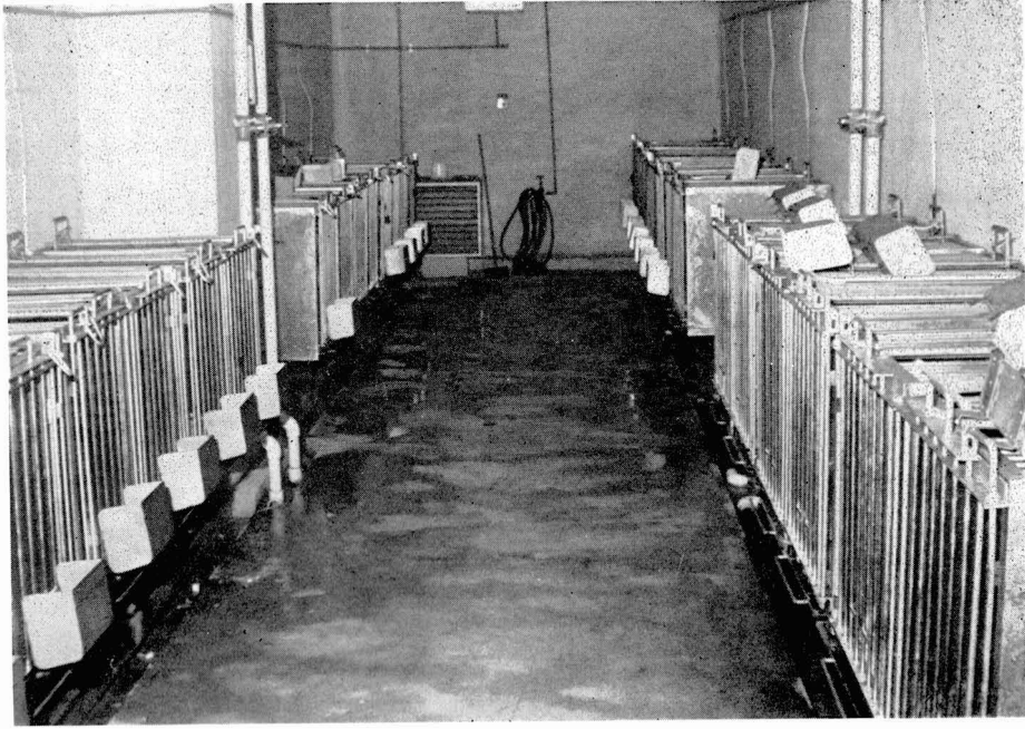
サル類保健飼育管理施設のケージ室内部