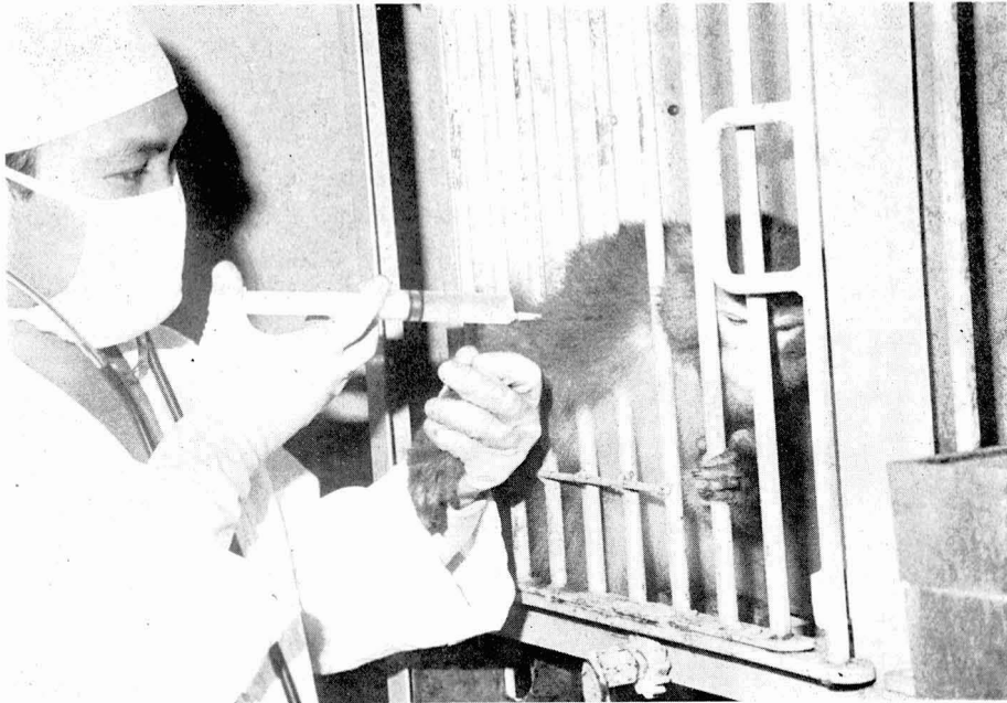
同施設教官によるサルの治療