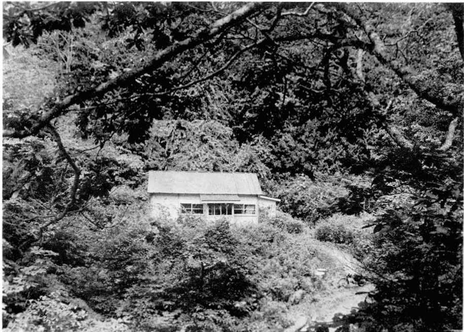
下北研究林（予定地）のプレハブ棟