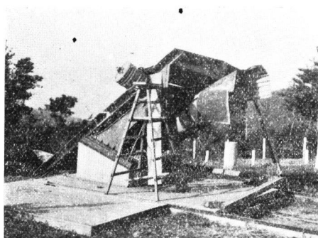
46糎反射鏡室の惨状 (應急處置後撮影)