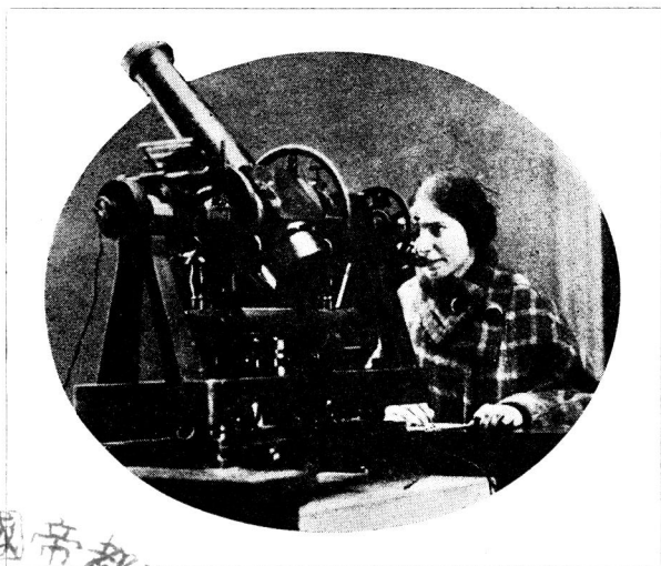
ある夜の子午線観測