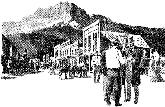
(カリフオニヤの一驛)

朝から左舷にはメキシコ国内の下カリフオニヤ洲の Miraflores 山其他の山々が見える。午後から夕刻にかけてマグロ群や、飛魚の群等が盛んに船から見える。日没は美しかつたが、低雲のため緑閃光は見えなかつた。19時半から、船の後甲板で映畫を見た。客が少ないので、1等から3等まで皆一所で、