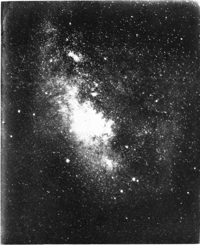
(Tessar 4.5, 露出 100分)