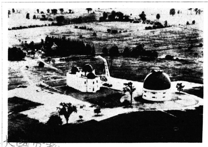
デヴィッド・ダンロップ天文臺 (トロント大學)