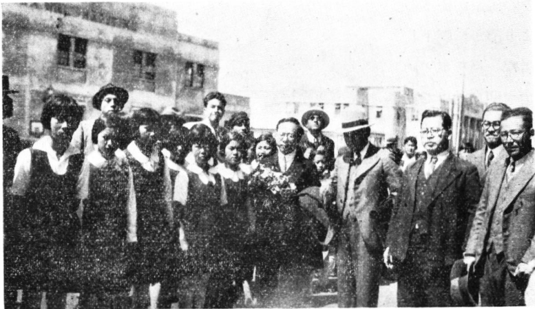
(カヤオ市日本人小學校生徒の出迎へ)

船は超満員で大賑ひ、晚餐の席も賑やかであつたが、其の後5、6人で船のブリヂのまだその屋上に登りつめ、冷風に當りながら、晴れた星々を指しつゝ話し込んだ。細川通譯官が、意外にも天文學の造詣が深いので、“いつの