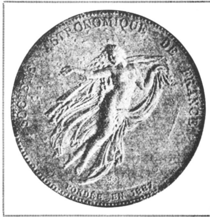
(フランス天文學會)