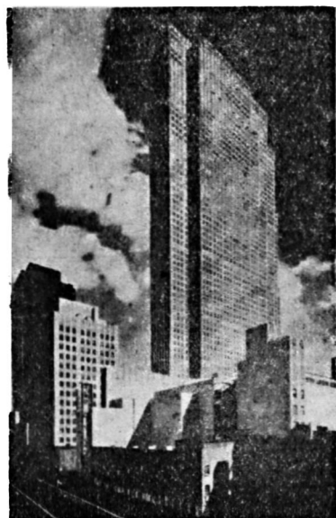
R. C. A. ラジオシチイ

は、目下建築中のプラネタリウムを見るやうに、ツアイス会社の人々に薦められたからである。それで、今日は早速其の場所へ行つて見た。此所はノース・サイドで、オハヨ街とフェデラル街との交る所で、もと市役所のあつた跡で、建築は今第一階だけを終つたばかり、完竣は前途尙遠い。“Buhl Planetarium”と名が表示されてゐる。