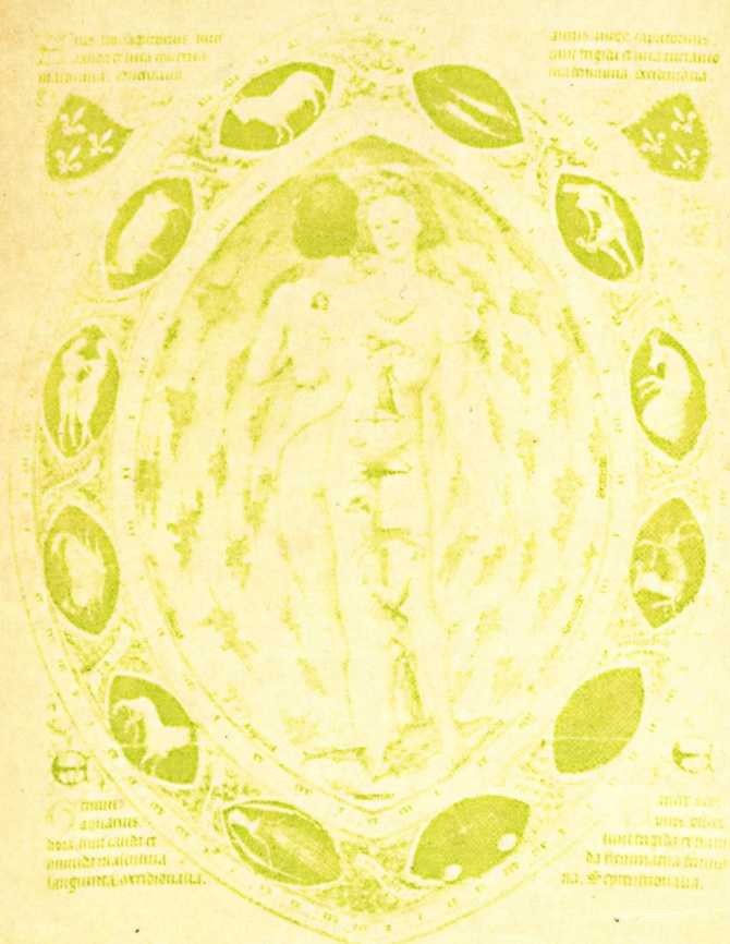
十二宮像 ベリ公の蔵書に所載のもの (15世紀) [シャンテリのコンデ博物館蔵] 天界五月號附録参照