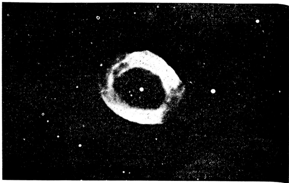
琴座の環状大星霧 (距離 2600 光年)