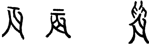
(1) 辰の字の最古の形

動物たること丈は明である。もし之を“曉天に兩手で捕へる”との意味に出来てゐる文字を捜してると、それは即ち辰の字で、こは臼(兩手)と辰とから成立つてゐるのである。つまりその元始形式の本來のところは(2)の通りである。