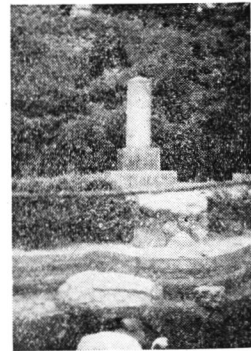
金星臺全景