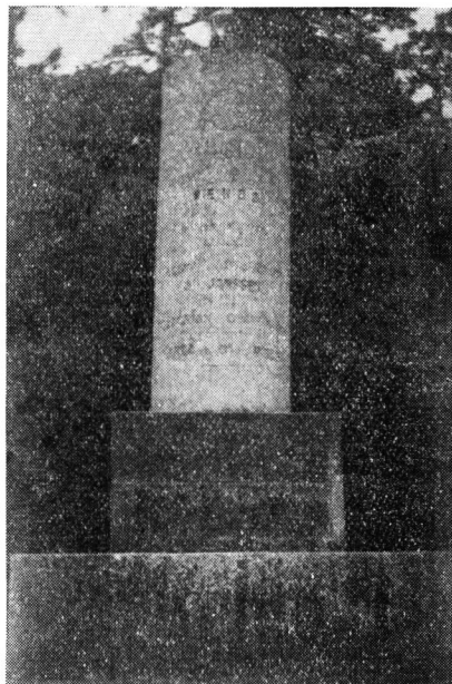
金星臺記念碑 (SI 生撮影)