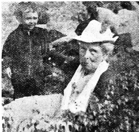
Late Miss Annie J. Cannon, at Oak Ridge Station of Harvard College Observatory, May 21, 1939.