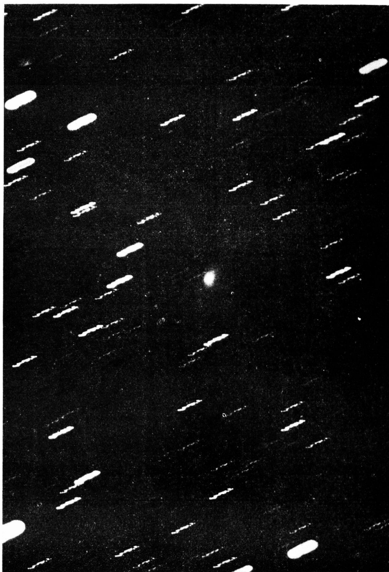
獨國ベルゲドルフ天文臺リペルト望遠鏡にて撮影