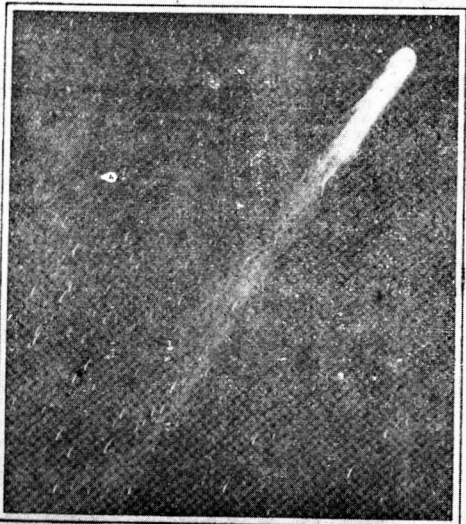
The Brooks Comet, a Visitor in 1911.

It is the nebulosity alone which will enable amateur observers this week to distinguish between the new comet and the neighboring stars. Through a pair of field glasses or a small telescope the stars will appear as sharp points of light, while the comet will have a diffused or fuzzy aspect.