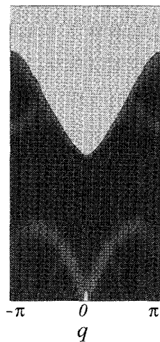
(a) photo-induced TL-liquid