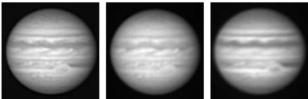
図1: 1999年9月9日、飛騨DSTで撮影。左、白色光。中、赤色光。右、青色光。 (浅田正記)