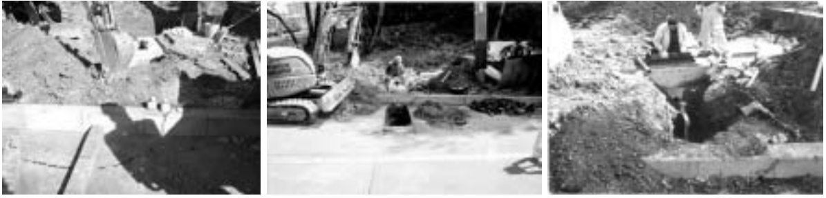
メーター取付工事の様子