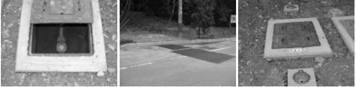
メーター取付工事終了