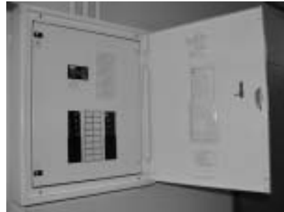
太陽館分電盤の様子