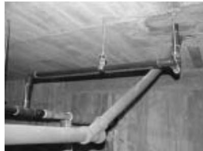
(右) 太陽館玄関横の配管の様子