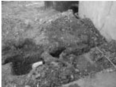
(左) 太陽館地下の配管の様子