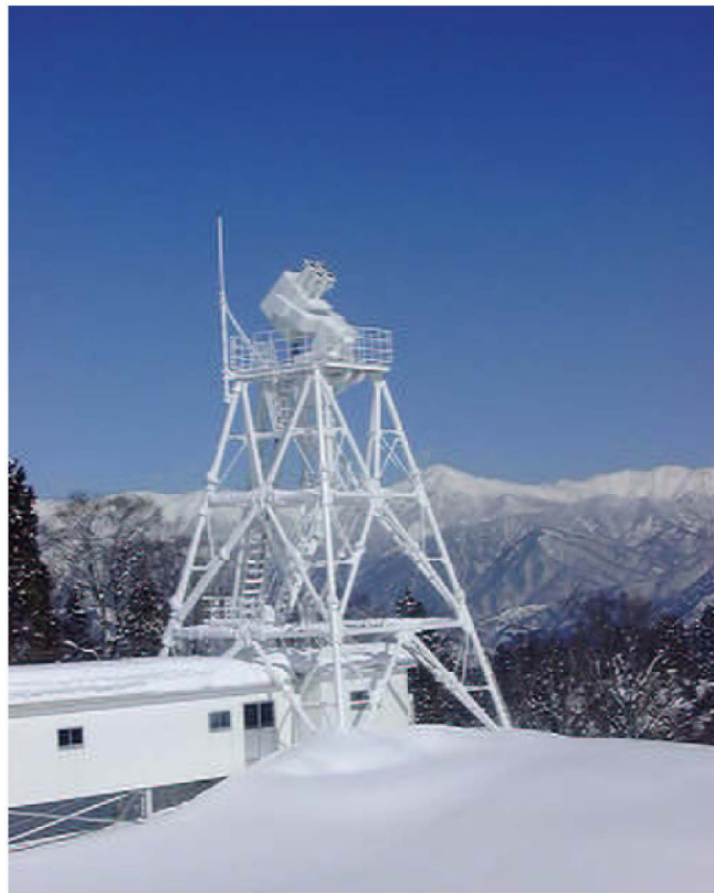
図1: 厳冬の中の飛騨天文台の太陽磁場活動望遠鏡

飛騨天文台に新設された太陽磁場活動望遠鏡 (Solar Magnetic Activity Research Telescope: SMART: スマート) は図1の写真のように2月の厳冬期でも設計どおりに作動することが確認できました。裸のまま厳しい自然に晒された中で、望遠鏡蓋及び側面パネル開閉や内部の空調システムなどを安定に作動させることは非常に難しい課題でしたが、1年を通した立ち上げテスト観測の中で、様々な測定と最適化調整を経て確認されました。SMARTの目的は、我々人類と地球にとって最も大切な太陽の活動を詳しく調べることです。そのためには、太陽全面に互って出来るだけ高分解能且つ高精度で、太陽表面の三次元磁場構造の変化とそれによる太陽プラズマ活動現象の変化を同時に観測する必要があります。このため SMARTには、次のような新しい多くの工夫がなされています。