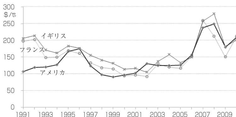
図2 フランス、イギリスとアメリカ3国の小麦生産者価格の比較