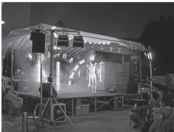
写真 5 北ブドック工業食品連合会の歌台 (2011 年 8 月 19 日)

場からも離れた場所に、小さなテントがたてられ、そこで歌台が行なわれたが、みていた観客はその工業団地で働く、中国本土からの出稼ぎ労働者ばかりだったのである。 36) 福建語がなかなか通じなかったことから、司会者も歌手たちも通常のギャグがなかなか使えず、結局はマンダリンで、観客との対話をするはめになっただけでなく、最終的には法規違反ではあるものの、観客の間に司会者と歌手が降り立って、観客と一緒に歌を歌う、という形になってしまった。