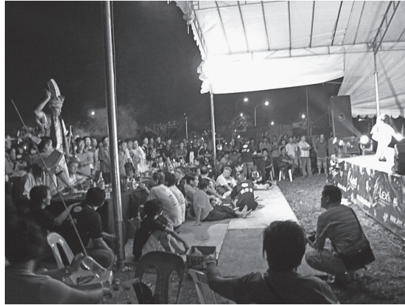
写真 10 勸世歌《大二爺伯》に反応して立ちあがってポーズをとる大爺伯（2011年8月23日）

せ、観客に食べさせたり、「ラッキー・ナンバー」と称されるものを提示したり、 57) 彼らが祝福した勸世歌のCD 58) を配布したりするのである。必ずしもすべての大二爺伯がこうした祝福を観客にも与えてくれるわけではないが、集まった観客たちは、神明たちが祝福を分け与えてくれるとなると、ありがたくこれを拝受するのである。