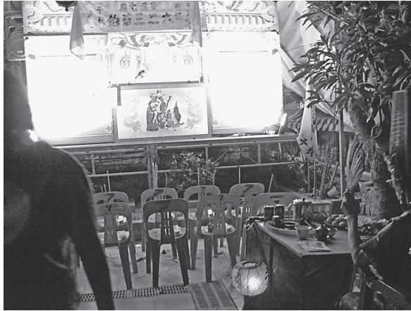
写真9 寺廟内で行なわれる布袋戲をみる二爺伯（2011年8月16日）

この形の歌台を楽しむのは、呪が勸世歌化している、シンガポールに特徴的だといわれる地界の神明たちである。大二爺伯、包貝爺などのうち、特に歌台を好むのは大二爺伯であるといわれ、信者たちも「大爺伯は歌台が好き」であると認識し、自分たちの寺廟、神壇の大二爺伯の千秋にあたって、歌台と大二爺伯のための宴席を用意し、他の関係の深い寺廟の大二爺伯たちを招いて盛大な祝宴、歌台を行なう。それぞれの寺廟、神壇で大二爺伯の千秋の日は異なることから、複数の神壇の多数の童乩に降臨した大二爺伯たちが一堂に会し、1会場で10名以上も大二爺伯が集まることもある。