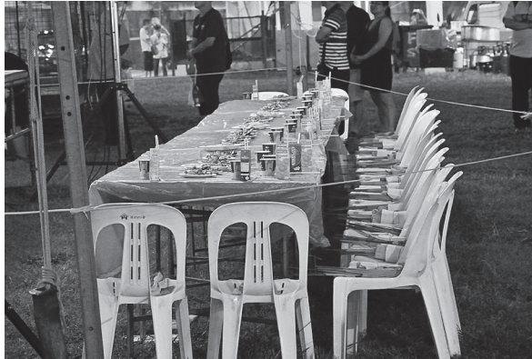
写真6 ステージ前に設置された孤魂のための席（2012年8月29日）

ている線香とろうそく、金銀銭を出してきて、孤魂たちのために捧げる小さな儀礼を行なったところ、照明の点滅が止まった。それ以降は、舞台がある時には必ず、事前に必ずこの小さな儀礼をすることになっている。 37)