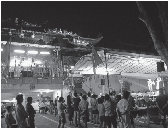
写真 3 保安宮の歌台

いわば縁起担ぎのようなものであるため、宗教の違いやエスニシティの違い、国籍の違いな