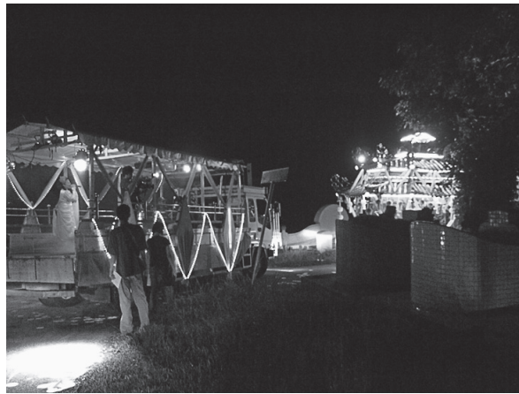
写真7 墓場での「モバイル歌台」(2011年8月20日)

のもと、ランタン・ダンス 43) が行なわれていたほか、その善堂が設置した陰府 44) には、他の神壇の童乩たちに降臨した大二爺伯が拝礼を行なうなど、ひとつの宗教団体の枠を超えて、多くの宗教団体同士が儀礼空間を共有していた。数多くの神壇が集まり、さまざまな神明たちが多くの童乩たちに降臨し、それぞれがそれぞれの場所で、それぞれの儀礼を行なう。墓地の通路に盛大にろうそくと線香をたて並べ、魂を導く儀礼を行なう神壇、墓地の通路に盛大に紙銭を撒きながら、童乩とともに儀礼の場所へと向かう神壇もある。また儀礼の終盤にあつて、すでに神明と霊魂たちを送る段階にある神壇は、儀礼につかた張りぼての神像やお札、建物、船、多くの紙銭などを、街中では決してみることができないほどの盛大な規模で焚き上げており、あたりがその焔でまぶしくなるほどであった。