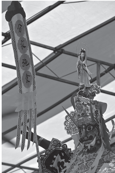
写真4 大土爺と頭上にいる観音像

どを超えて、関係者の多くが名目上、中元会に参加することになる。職業連合の場合、工業団地の各ブロック、業種ごとに中元会を結成、市場などではフルーツ組合、野菜組合などがそれぞれに中元会を結成して中元節を実施することになる。また〇〇通り商店会などのような組織や〇〇団地中元会などの場合には、地域の枠組みが組織の重要な外枠となり、当該地域の商店や団地住民が会員となって中元節を行なう。この場合には、地域の枠組みが強く反映されるものの、職業連合などの場合とは異なり、自由意思での参加となることが多いようである。クラン・アソシエーションの場合には、人のつながりが重視され、中元節実施の目的は組織の維持のほか、人間関係の再確認、再構築の意味合いももつ。