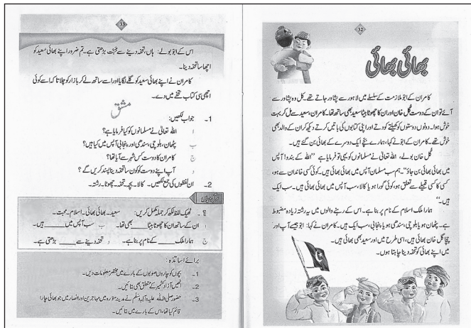
写真 2 پنجاب Urdu 2nd grade (*IV-4-4)

右ページの枠内は目次，その下に編集者，出版社，発行所，出版部数などの情報，左ページは第 1 課神への賛美をうたった詩。イラストはカアバ神殿 [PTBB 2000a: 内表紙裏, 1].