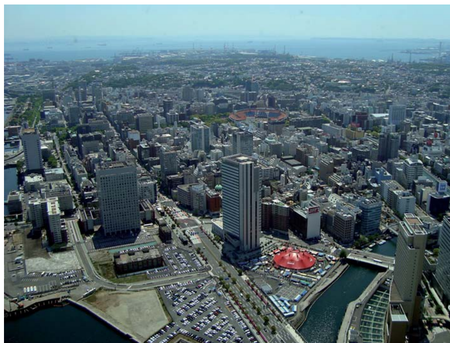
F11 - Yokohama Landmark Tower, parte della città di Yokohama con il porto internazionale. Le aree verdi in prossimità del porto rappresentano il quartiere Yamate, quartiere degli stranieri alla fine del XIX secolo: qui era ubicata anche la scuola dove ha insegnato Ragusa. In questo quartiere, ancora oggi, esistono edifici costruiti da inglesi e spagnoli.

pubblico, costituisce il fondo Ragusa più importante che si custodisce in Italia.