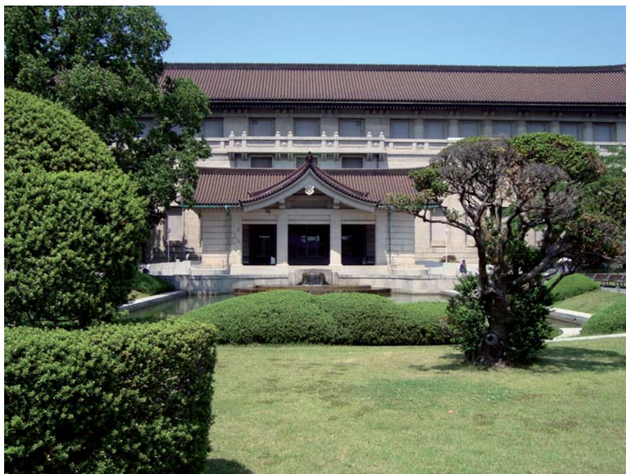
F13 - La sede dell'Honkan Museo Nazionale di Tokyo, che accoglie attraverso esposizioni temporanee opere di artisti occidentali in Giappone; qui sono state esposte anche le opere di Ragusa.