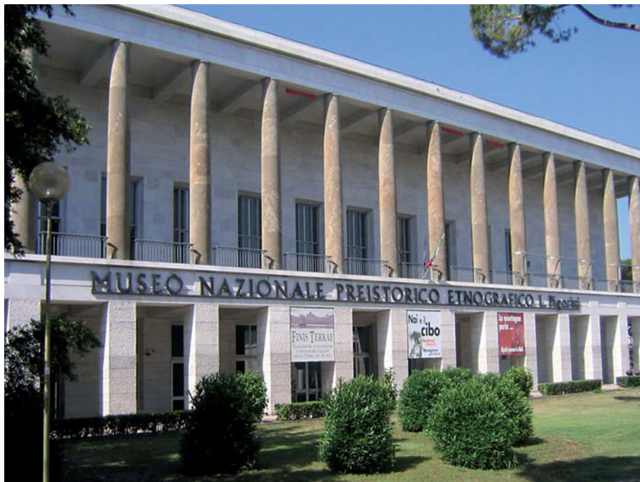
F12 - Museo Etnografico Pigorini di Roma.