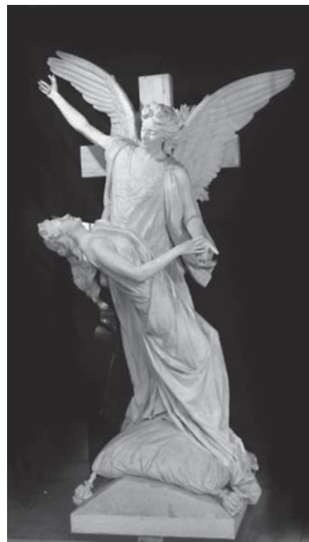
F8 - V. Ragusa, In opposto al cielo , 1910.

Più in dettaglio l'aspetto che aveva incuriosito molti artisti giapponesi, che con la Restaurazione Meiji erano venuti a contatto con le arti occidentali, era la capacità di rappresentare le espressioni emozionali attraverso il volto: felicità, soddisfazione, compiacimento, tristezza, dolore, sconforto, infelicità. Il tema