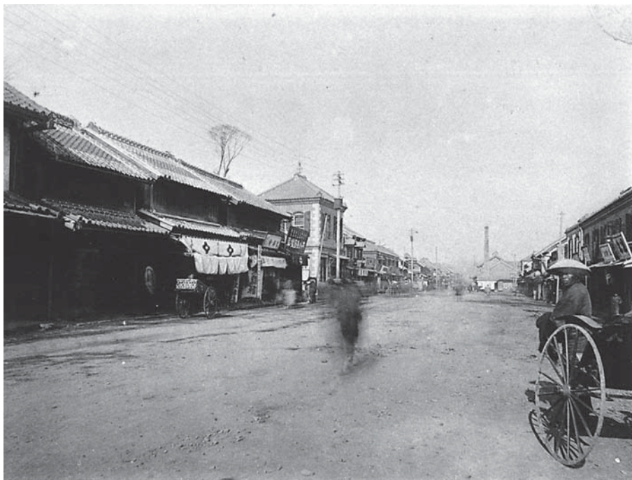
F9 - Tokyo. Mita Odori, Shiba-ku (attuale quartiere Minato-ku) in una foto del 1893. Nel 1893 Ragusa era già rientrato in Italia ma l'immagine fornisce l'idea del quartiere prima delle trasformazioni avvenute principalmente con la ricostruzione post seconda guerra mondiale.

giunti in Giappone assumevano ruoli istituzionali importanti e venivano denominati oyatoi gaikokujin ossia impiegati stranieri (6) . Vincenzo Ragusa si impiegò presso la Scuola d'Arte Industriale di Yokohama e qui insegnò