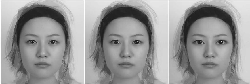
図2 魅力における目の大きさの影響を示す例。左から元画像、黒目拡大画像、目拡大画像。肖像権のため平均顔を示すが、実際には個々の顔画像を加工して使用した。