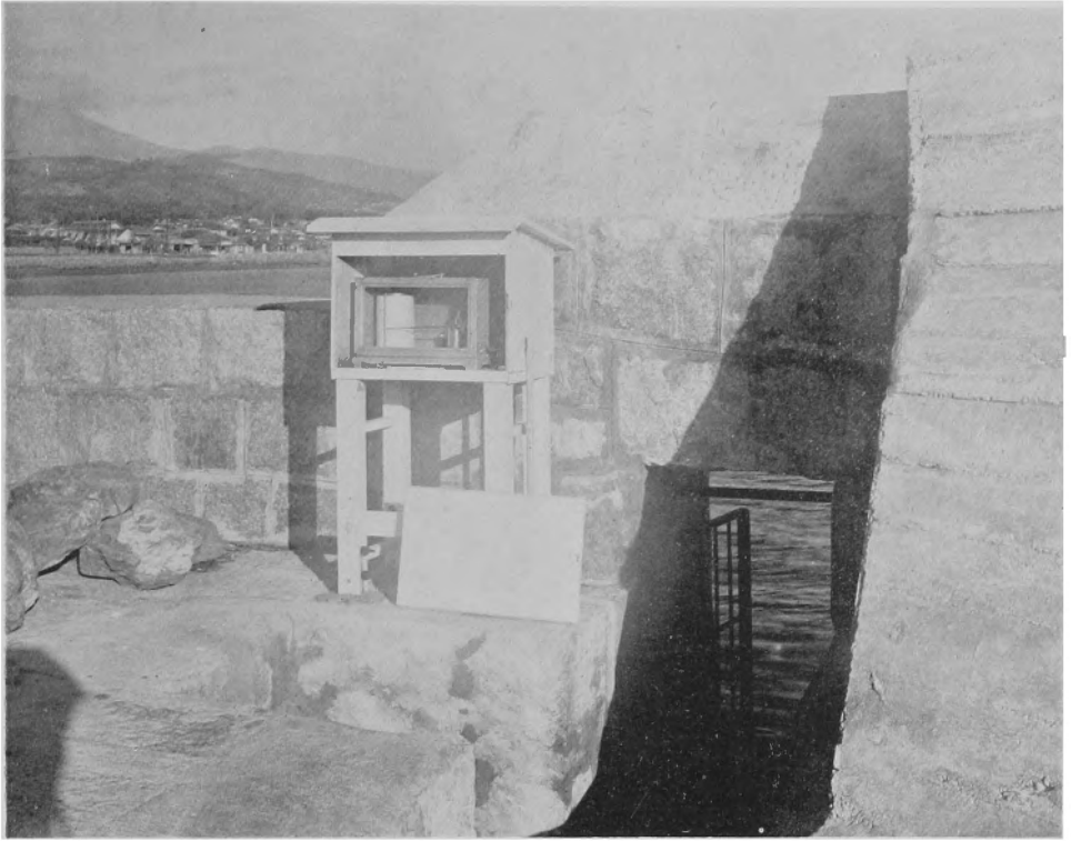
水 壓 式 驗 潮 儀