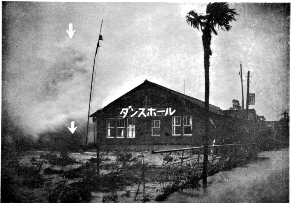
北埋立地鶴水園海岸 (當日午前9時頃撮影、推定波高16米)