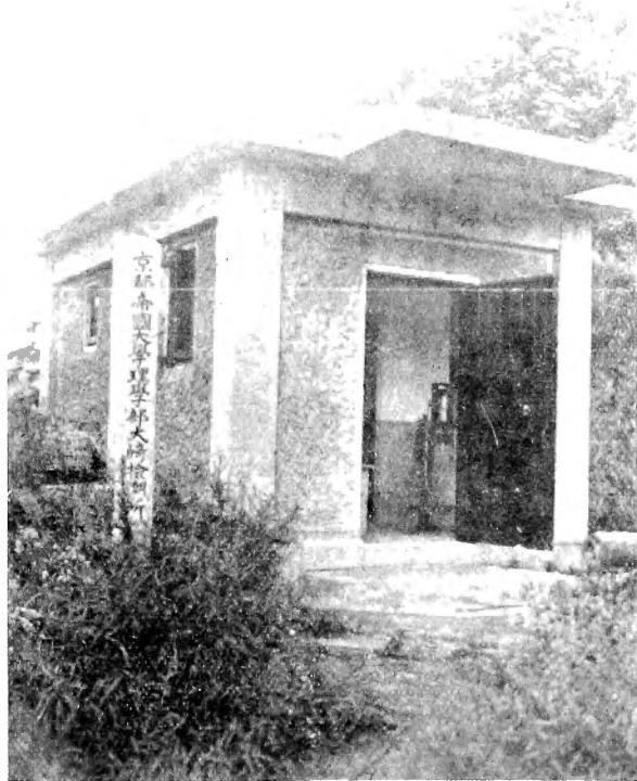
京都帝國大學大崎檢潮所